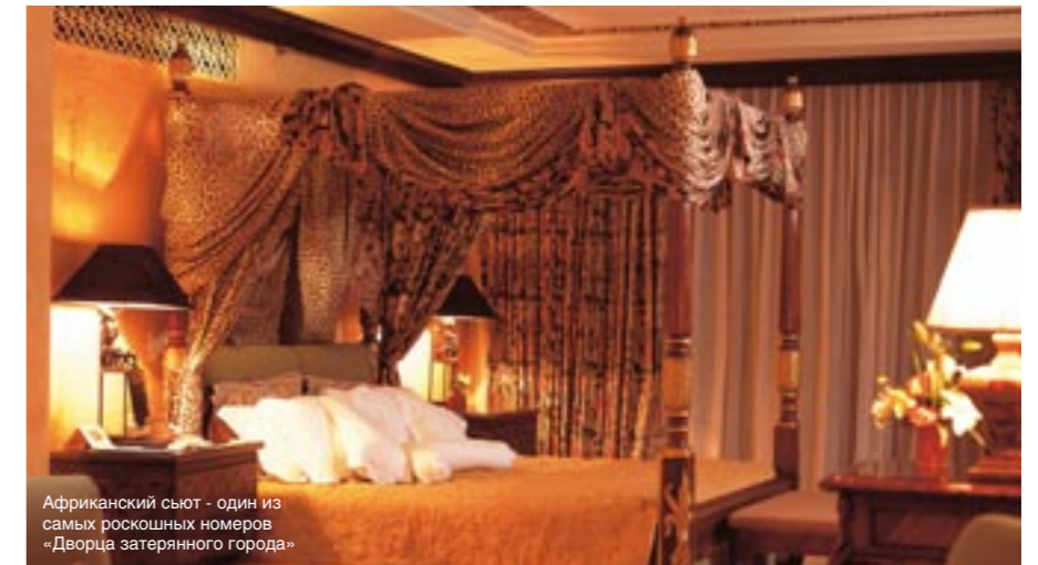
Африканский сьют - один из самых роскошных номеров «Дворца затерянного города»

НЕПОДАЛЕКУ ОТ «ДВОРЦА» РАСПОЛОЖЕН МОСТ ВРЕМЕНИ, КОТОРЫЙ КАЖДЫЙ ЧАС НАЧИНАЕТ ДРОЖАТЬ, А ИЗ ВНЕЗАПНО РАСХОДЯЩИХСЯ ТРЕЩИН ВАЛИТ ДЫМ