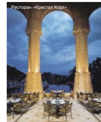
Ресторан «Кристал Корт»

миллионеров. На территории курорта есть еще 3 отеля, также принадлежащих цепочке Sun International: это пятизвездочные «Каскады» (The Cascades) с ботаническим садом на прилегающей территории; собственно гостиница «Сан-Сити» (The Sun City Hotel 4/5*), первая из построенных на курорте, в которой расположено знаменитое казино и театр «Экстраваганца», а также трехзвездочный «Кабанас» (Sun City Cabanas),