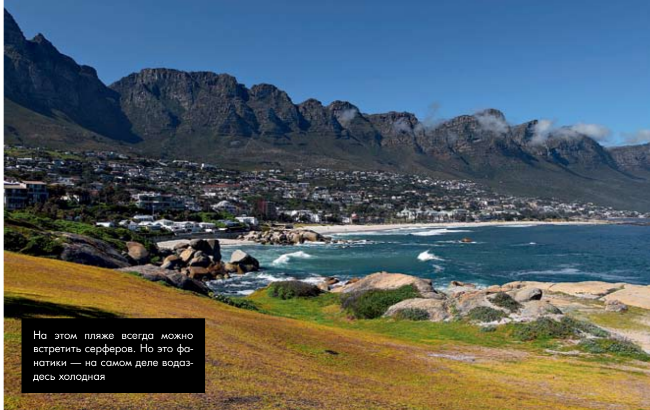
На этом пляже всегда можно встретить серферов. Но это фанатики — на самом деле вода здесь холодная