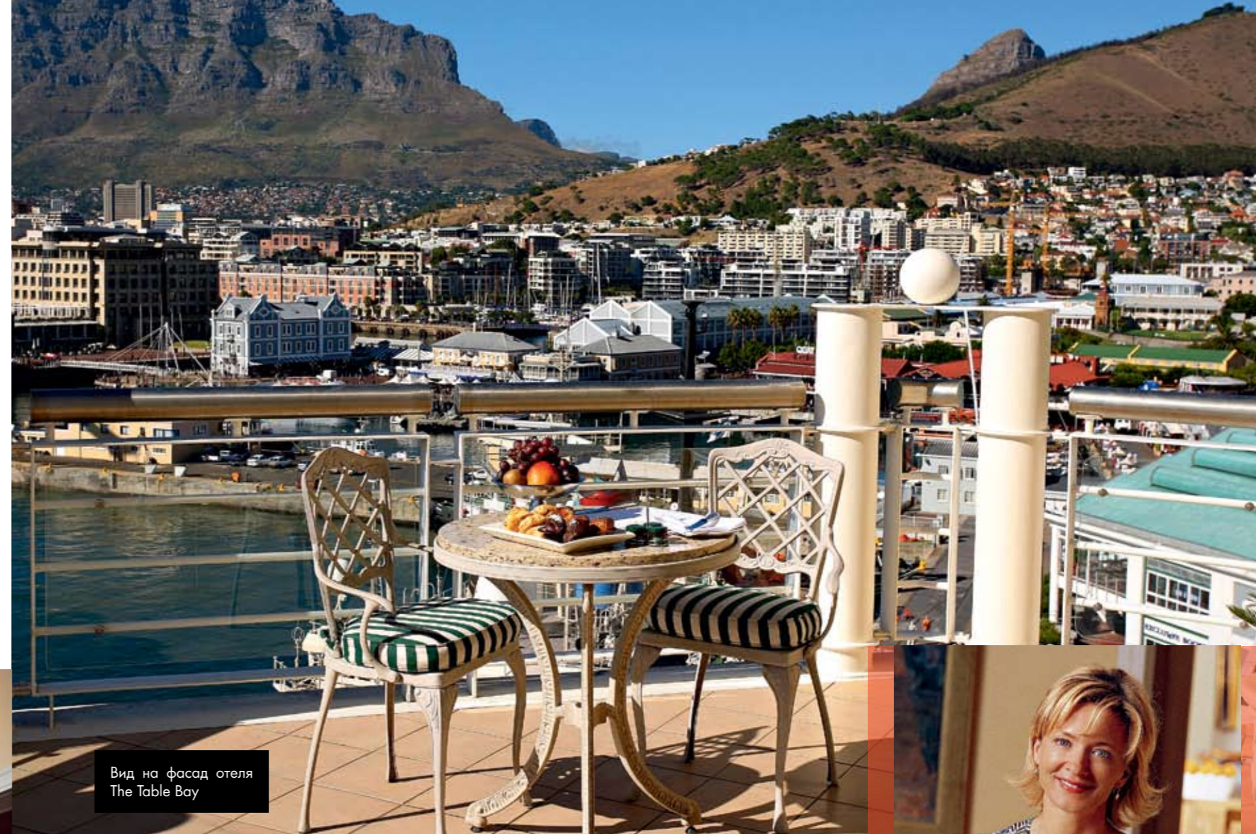
Вид на фасад отеля The Table Bay