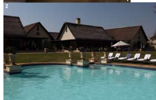
1 Веранда, на которой подают five-o'clock tea. 2 Главный корпус The Royal Livingstone. 3 Холл отеля. 4 Водопад Виктория.