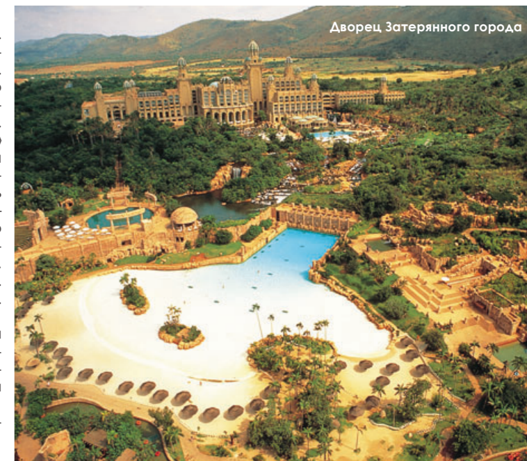
Дворец Затерянного города

И в интерьере отеля воссоздана настоящая королевская роскошь, выполненная с африканским колоритом.