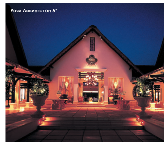
Роял Ливингстон 5*